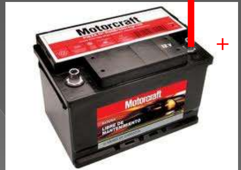
Bateria de servicio

Una vez arrancado el motor volveremos el interruptor a su posición de desconectado