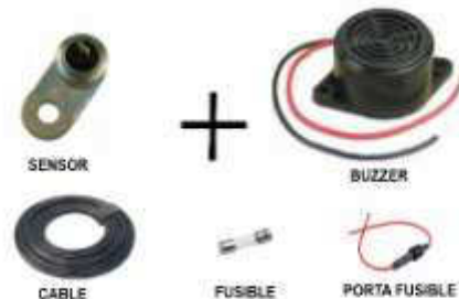
ALARMA TEMPERATURA MOTOR