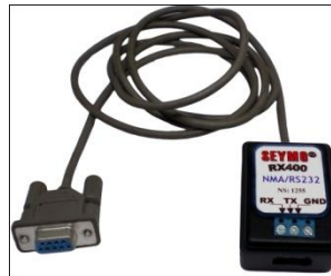
Diagrama de conexión Connection Diagram Schéma de raccordement Anschlussplan